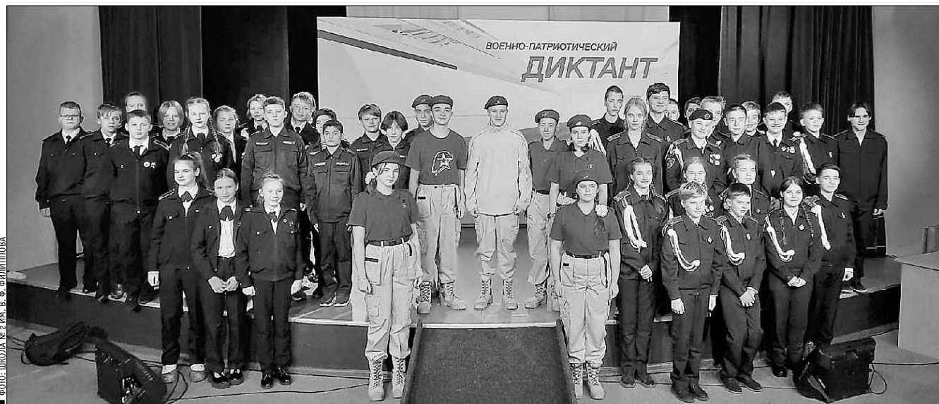
ФОТО: ШКОЛА № 2 ИМ. В. Ф. ФИЛИППОВА